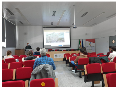
Asistentes a la charla en el Salón de Grados del CIBM